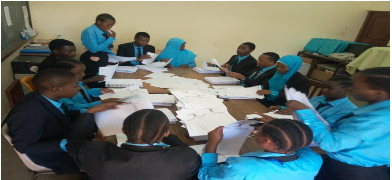
Mashati ya blue bahari hayo hapo juu kama inavyoonekana kwenye picha hapo juu