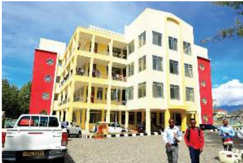
Jengo Jipya lenye vyumba vya mihadhara na Ofisi Chuo Kikuu Mzumbe Kampasi ya Mbeya