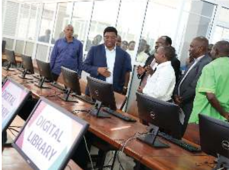
Maktaba ya Tehama Chuo cha Ualimu Korogwe