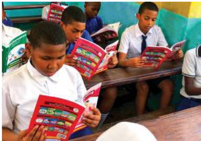
Usambazaji wa vitabu vya kiada na ziada shule za msingi na sekondari. Wanafunzi ya shule ya msingi Bunge wakitumia vitabu vilivyotolea katika Shule hiyo