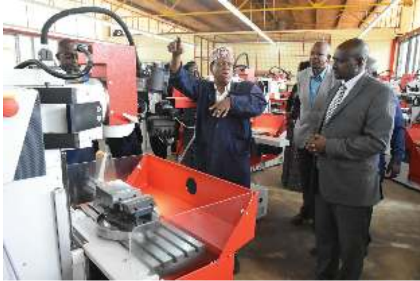
Mitambo ya kujifunzia Chuo Cha ufundi Arusha (ATC)