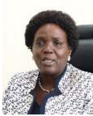
Mhe. Profesa Joyce Lazaro Ndalichako (Mb.) Waziri