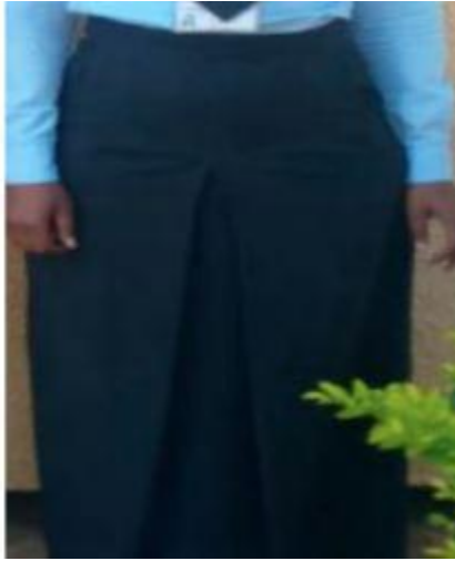
PICHA Na. 1